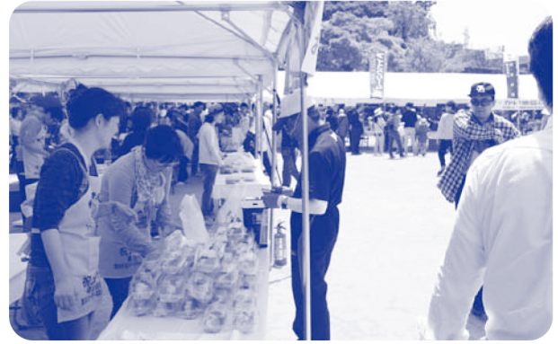
▲ 連合和歌山女性委員会の店