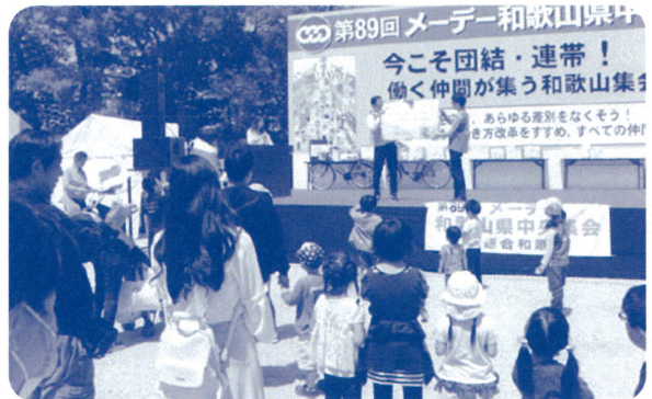
▲ ワークルール〇×クイズ