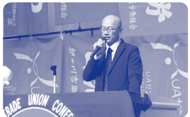
▲ 紀北地協メーデー