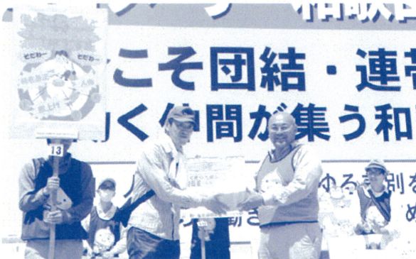
▲ プラカードコンテスト