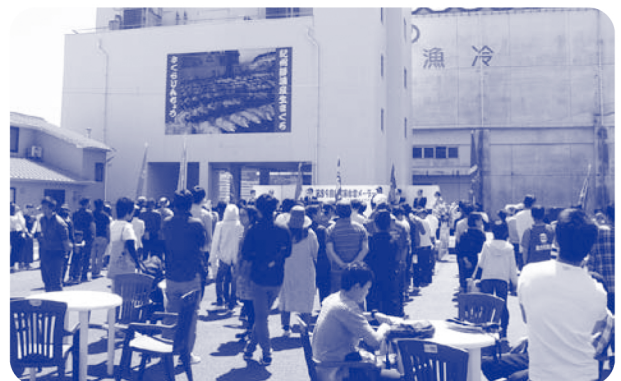
▲ 新宮・東牟婁地区協メーデー