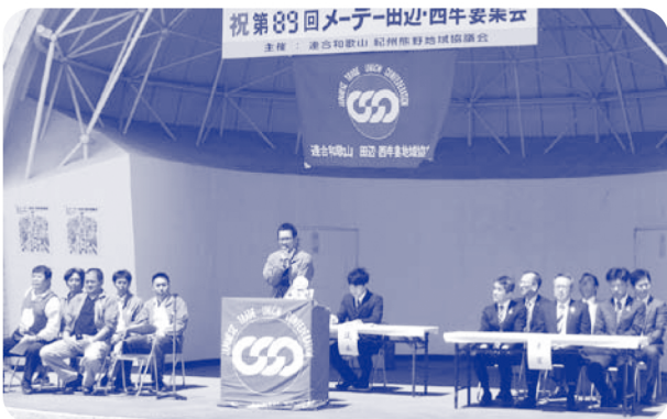
▲ 田辺・西牟婁地区協メーデー