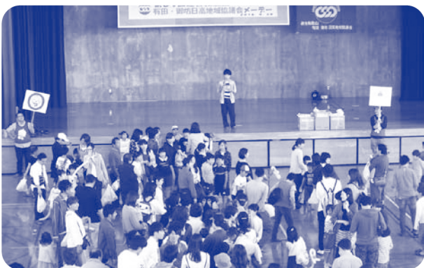
▲ 有田・御坊日高地協メーデー