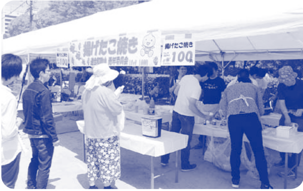
▲ 連合和歌山青年委員会の店