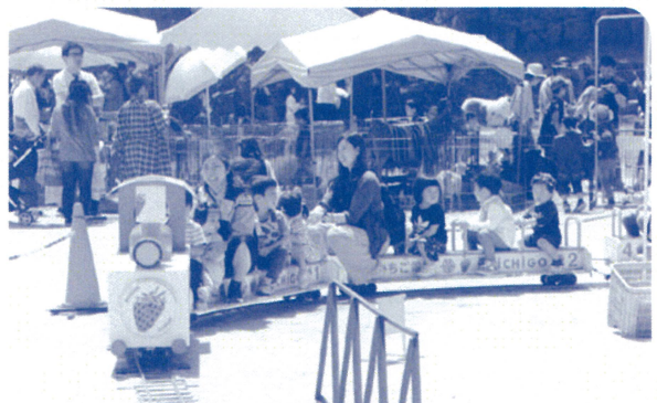
▲ ミニいちごトレイン