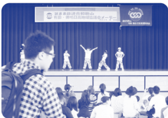
▲ 有田・御坊日高地協メーデー