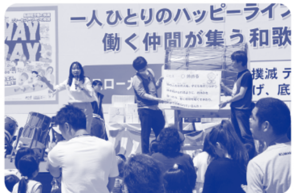
▲ワークルール〇×クイズ