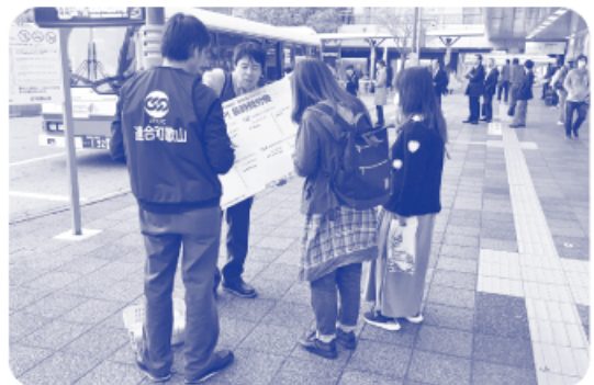
▲和歌山駅前での様子

14日(金)の街頭アンケートに、連合和歌山執行委員会構成員から17人が参加しました。