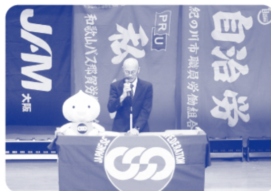
▲ 紀北地協メーデー