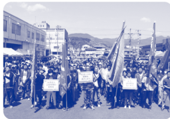
▲ 新宮：東牟婁地区協メーデー