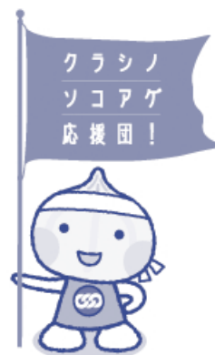
RENGOキャンペーン 一人ひとりが主役です。