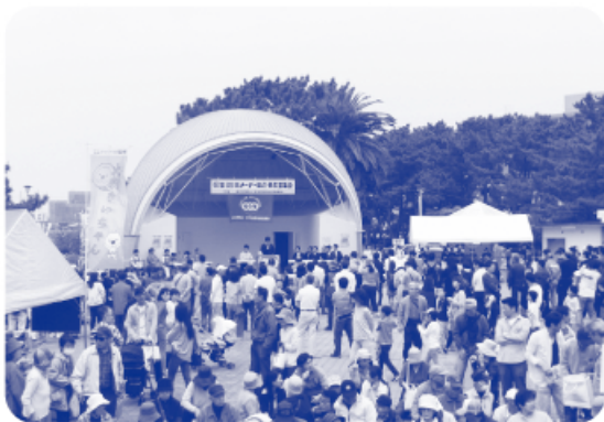
▲ 田辺：西牟婁地区協メーデー