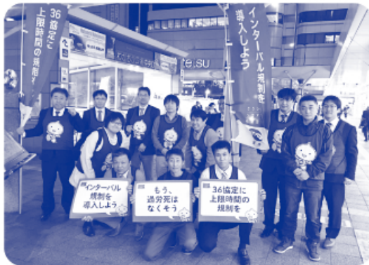
▲街頭アンケート参加者

2017年4月14日(金)和歌山市「JR和歌山駅前」において、2017年4月30日(日)和歌山市「和歌山城砂の丸広場(第88回メーデー和歌山県中央集会所)」において、クラシノソコアゲ応援団！RENGOキャンペーン長時間労働是正のアンケートを実施しました。