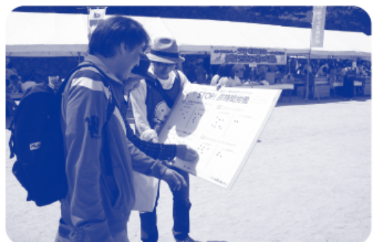
▲メーデー会場での様子