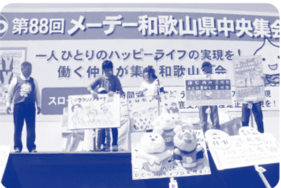
▲プラカードコンテスト