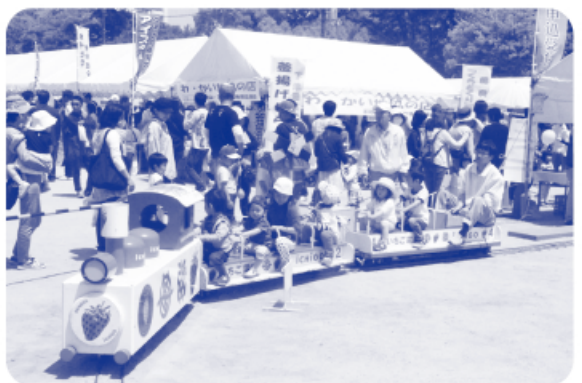
▲ミニいちごトレイン