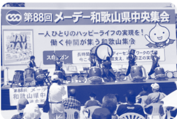
▲和太鼓集団和響による演奏