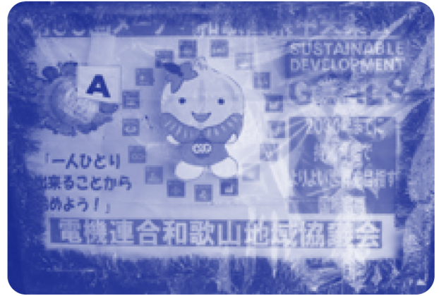
▲和歌山県職員労働組合本部