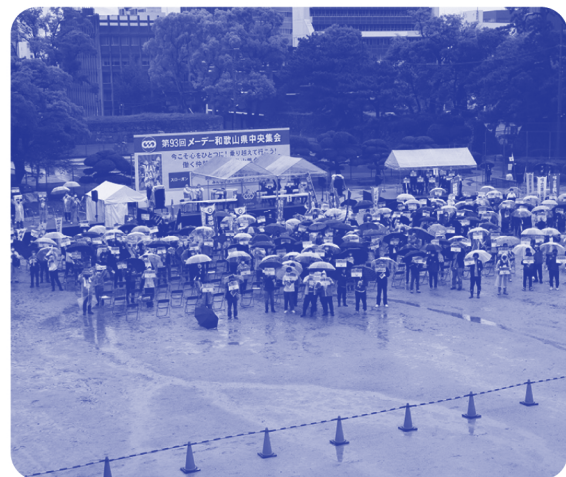
▲参加者による平和メッセージ