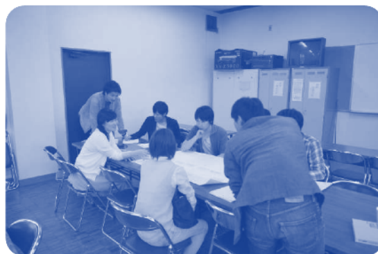
▲グループディスカッションの様子