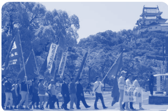
▲「格差是正」、「雇用の安定」を訴えデモ行進

なお、当日、メーデー会場内で行われました「熊本県を中心とする九州地震災害」救援カンパの合計金額は66,110円となり、その全額について、連合本部を通じて被災県に対して義援金として届けられます。