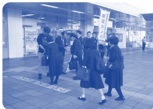
▲救援カンパの様子