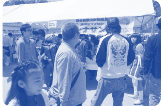
▲女性委員会の模擬店（ツナサンド）