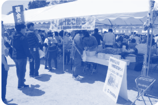
▲青年委員会の模擬店（揚げたこ焼き）

模擬店での売上金 99,350 円は、メーデー会場で行った熊本県を中心とする九州地震災害に対する救援カンパと併せて、連合本部を通じて被災県に対して義援金として届けられます。