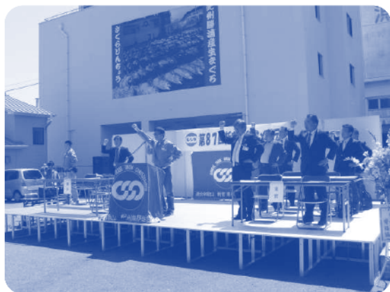
▲新宮・東牟婁地区協メーデー