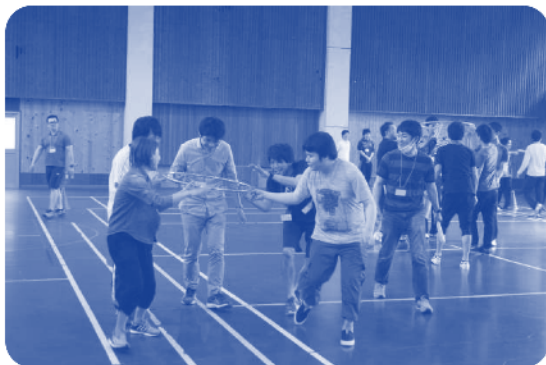
▲スポーツ交流会の様子