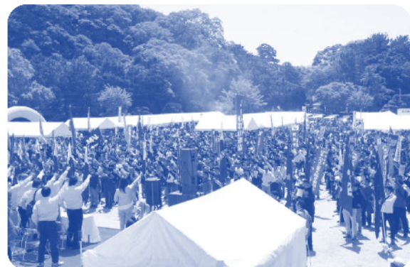
▲多くの参加者が集会に参加