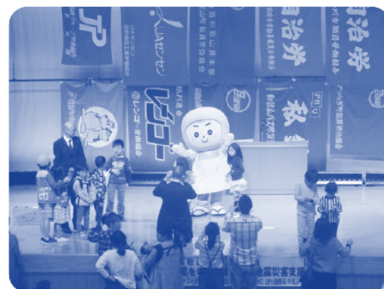
▲紀北地協メーデー