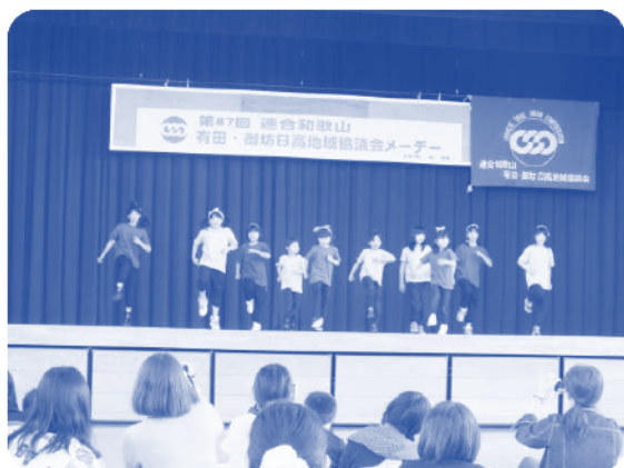
▲有田・御坊日高地協メーデー